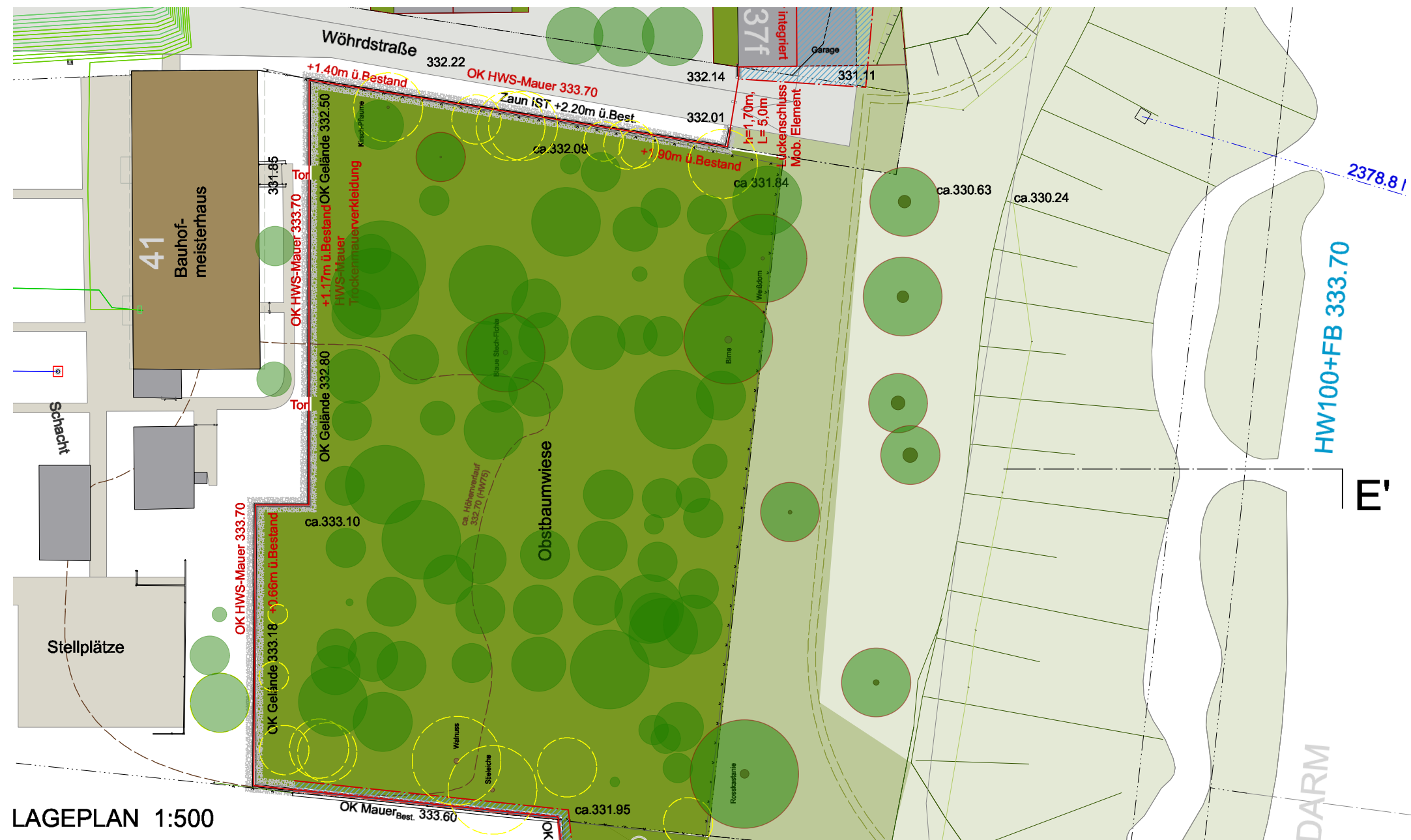
LAGEPLAN 1:500 Planabschnitt 1.4 / Wöhrdstr. 41