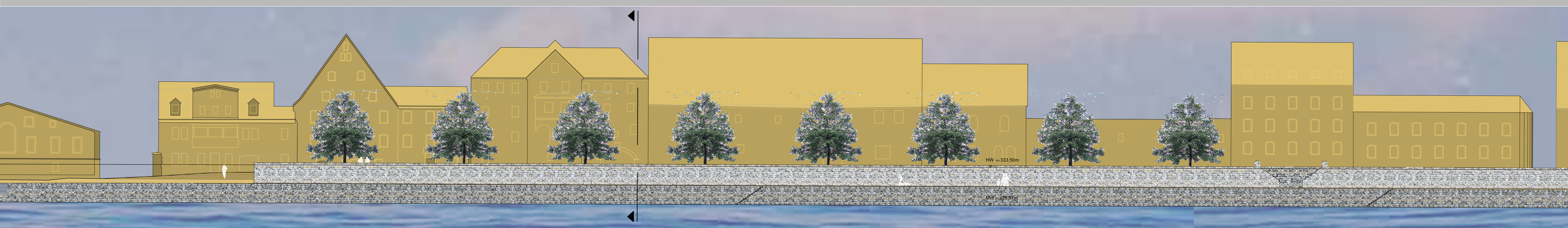
ANSICHT M 1:200